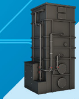
Zbiorniki wolnostojące, technologiczne, wielkogabarytowe