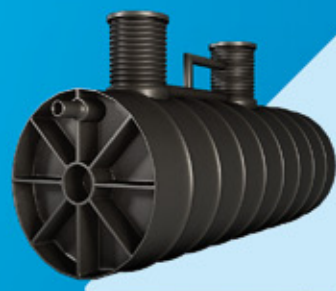
Studnie, zbiorniki, przydomowe oczyszczalnie ścieków