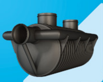
Separatory substancji ropopochodnych