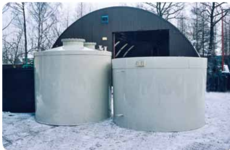
Zbiornik na media żrące z wanną wychwytyjącą - rysunek poglądowy.