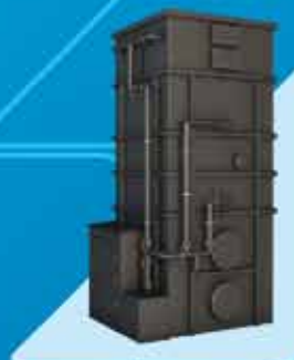
Zbiorniki, instalacje technologiczne - produkcja i montaż