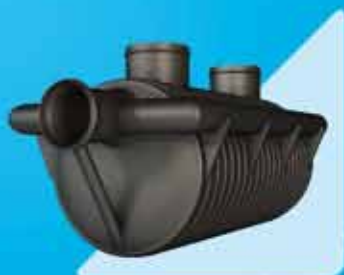
Separatory substancji ropopochodnych