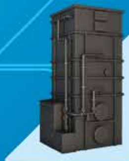
Zbiorniki, instalacje technologiczne - produkcja i montaż