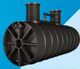
Studnie i przydomowe oczyszczalnie ścieków