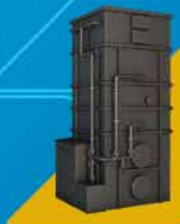
Zbiorniki i instalacje technologiczne